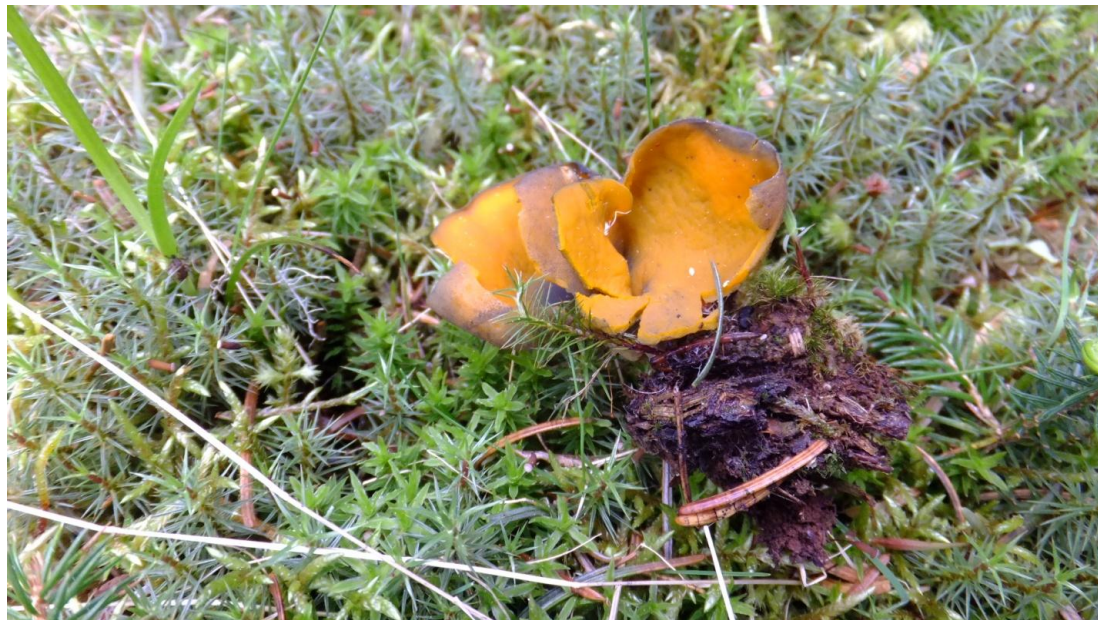
Рис. 4. Апотеции гриба Caloscypha fulgens в мохово-осоковом покрове пихтово-елового леса.

Таким образом, на сегодняшний день микобиота государственного природного заповедника «Ботчинский» включает 43 вида грибов с оперкулятными сумками, объединенными в порядок Pezizales, подотдел Pezizomycotina отдела Ascomycota. Среди ООПТ Хабаровского края видовое разнообразие этой группы грибов выявлено наиболее полно.