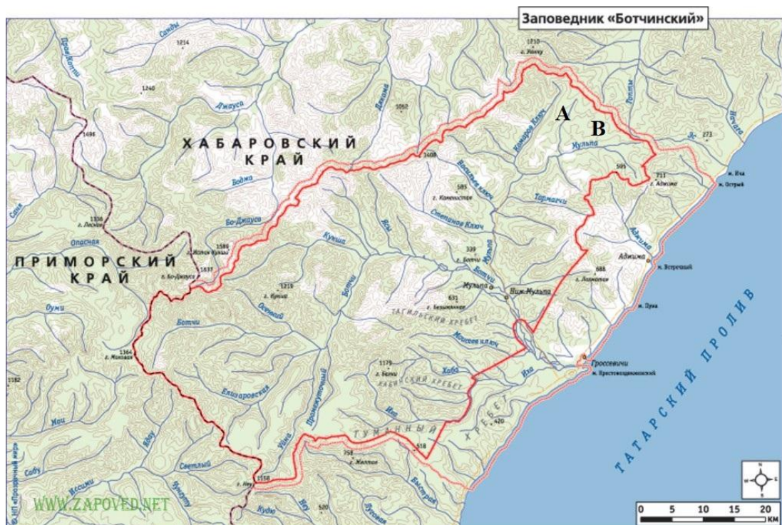
Рис. 1. Территория государственного природного заповедника «Ботчинский»: А – район поисковых работ в верхнем течении ручья Солончаковый; В - район поисковых работ в долине ручья Спокойный.

Возможные сроки для сбора видов весеннего сезона плодоформирования весьма коротки. Гидротермические условия, стимулирующие половой процесс у грибов этого сезона, изменяются быстро, согласно повышению температуры. Поэтому был сделан выбор участков, находящихся на разных высотах над уровнем моря – от 280 м над ур. м. в долине ручья Солончаковый до 540 м над ур. м. в долине ручья Спокойный. Различный температурный режим участков позволил провести сбор образцов, находящихся практически, на одном этапе развития плодовых тел. На участках вывала возрастных деревьев была обследована почва на предмет наличия плодовых тел грибов, а также изучены стволы выпавших растений и их корневые комы.