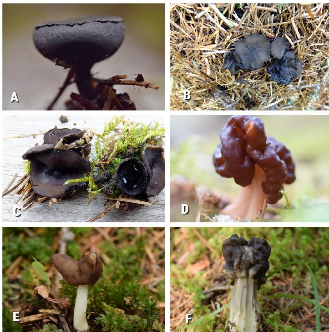
Рис. 3. Весенние виды оперкулятных сумчатых грибов, отмеченных на территории заповедника Ботчинский: А – Donadinia nigrella , В – Pseudoplectania melaena , С – P. nigrella , D – Paragyromitra infula , Е – Helvella elastica , F – H. lacunosa.

Fig. 3. Spring species of operculate ascomycetes noted in the territory of the Botchinsky Nature Reserve: А – Donadinia nigrella , В – Pseudoplectania melaena , С – P. nigrella , D – Paragyromitra infula , Е – Helvella elastica , F – H. lacunosa.