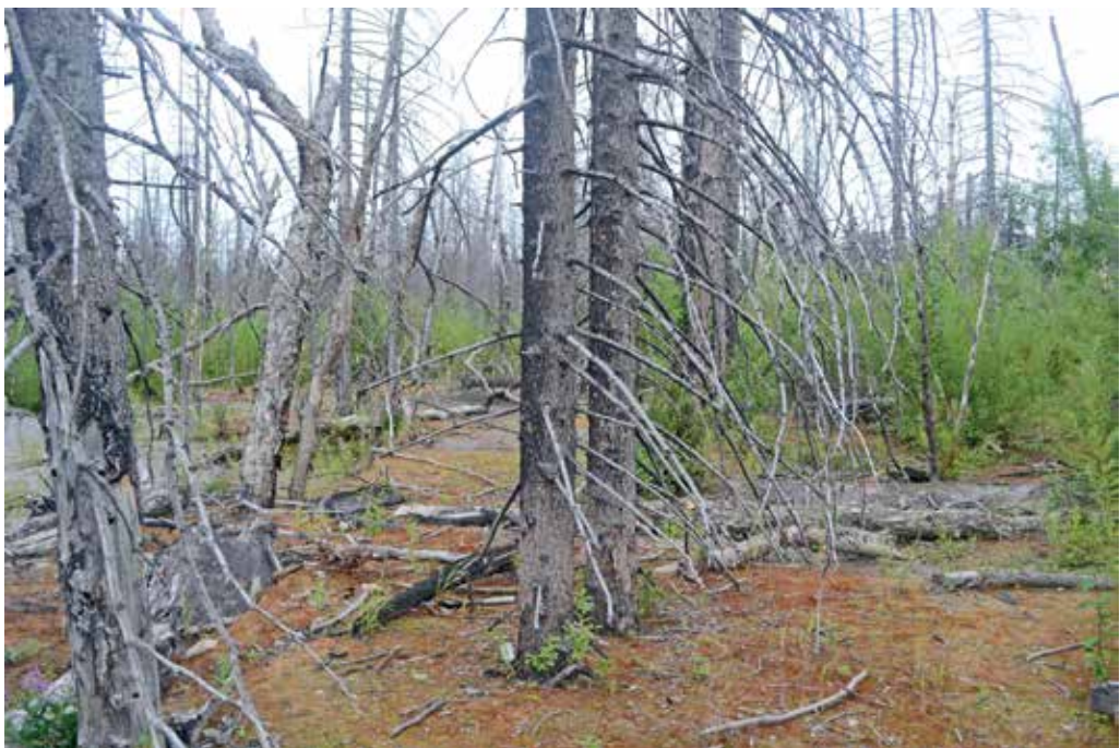
Рис. 8. Ельник, погибший в результате прохождения пирокластической волны. На дальнем плане – возобновление ивы удской. 2012 г.

Деревья, испытавшие воздействие пирокластической волны, погибли, но выглядят почти неповрежденными. Лишь ближе к краю потока и в верхней части долины, где воздействие волны было максимально интенсивным, можно увидеть стволы с обломанными ветвями. О силе волны свидетельствуют изгибание скелетных ветвей, обрыв хвой и тонких ветвей, обдирание коры, заброс кусков пемзы, включая глыбы до 30 см, на десятки метров вглубь леса, вмятины на стволах от ударов летевших камней и глыб, заброс большого объема тонкой пирокластики на расстояние до 200 м и более, опаливание и обугливание стволов и ветвей.