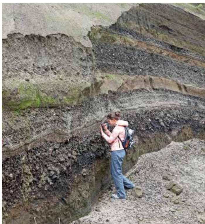
Рис. 6. Термальная стенка – участок разгрузки тепловой энергии крупной гряды горячей пирокластике извержения 2005 г.