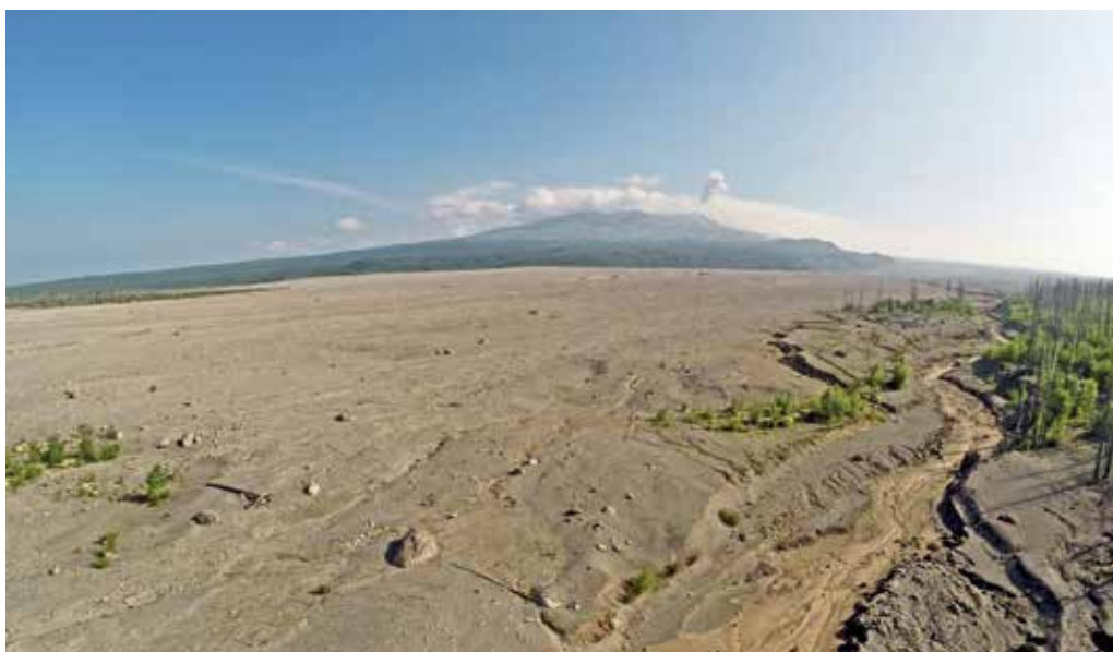
Рис. 2. Общий вид долины р. Байдарная. Справа – погибший и распавшийся еловый лес, на его месте интенсивно возобновляется ива удская. На дальнем плане – массив вулкана Шивелуч; виден газово-пепловый выброс из активного купола. 2017 г.

и почвенного покровов нами выявлялись специфика этого воздействия на экосистемы, а также реакция основных компонентов экосистем на него и начало восстановления экосистем после полного уничтожения. Результаты наблюдений в первые годы (2005–2007) были опубликованы [7, 8, 10]. В данном сообщении рассматриваются природные изменения, произошедшие главным образом в последующее десятилетие (2008–2018 гг.).