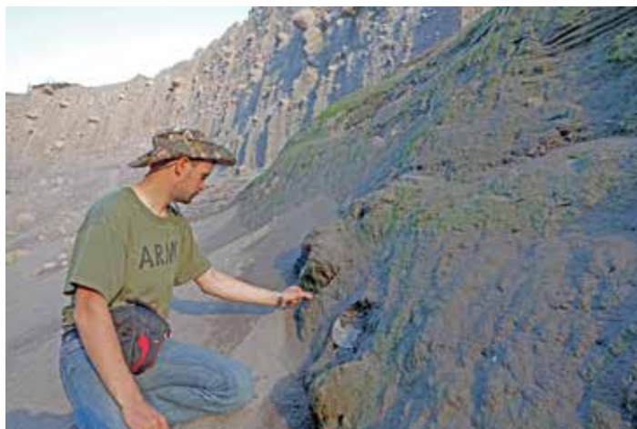
Рис. 5. Измерение температуры термальной стенки в «каньоне», образовавшемся в результате интенсивной эрозии водно-грязевыми потоками нового русла р. Байдарная. Стенка покрыта мхами и водорослями. 2014 г.

глубине 10 см слегка парящей стенки, покрытой мхами, водорослями и единичными сосудистыми растениями. Другим местом тепловой разгрузки является участок погибшего леса площадью около 5000 м 2 (этот лес известен всем полевым отрядам, работающим в последние годы на Байдарной – возле него отряды разбивают лагерь). Деревья (береза каменная) здесь погибли от перегрева субстрата. Гибель по этой необычной причине, как было выявлено по спутниковым снимкам, произошла в 2013 г. и первоначально была необъяснимой, поскольку погибшие деревья находились за пределами зоны пирокластических