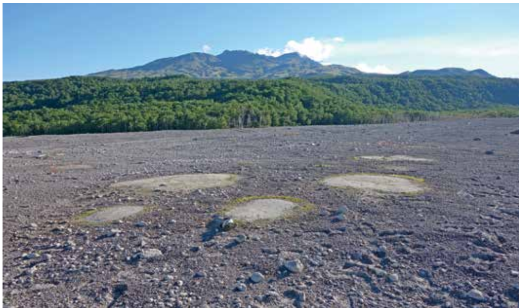
Рис. 4. Тепловые пятна в осевой части гряды горячих пирокластических отложений. Кайма образована мхами. 2014 г.

Заметное остывание крупнейшей гряды в 2013–2017 гг., возможно, связано с разгрузкой тепловой энергии, происходящей через стенки каньона, промытого новым северным руслом р. Байдарная (рис. 5). Температура, замеренная нами в 2014 г., достигала 82 °С на