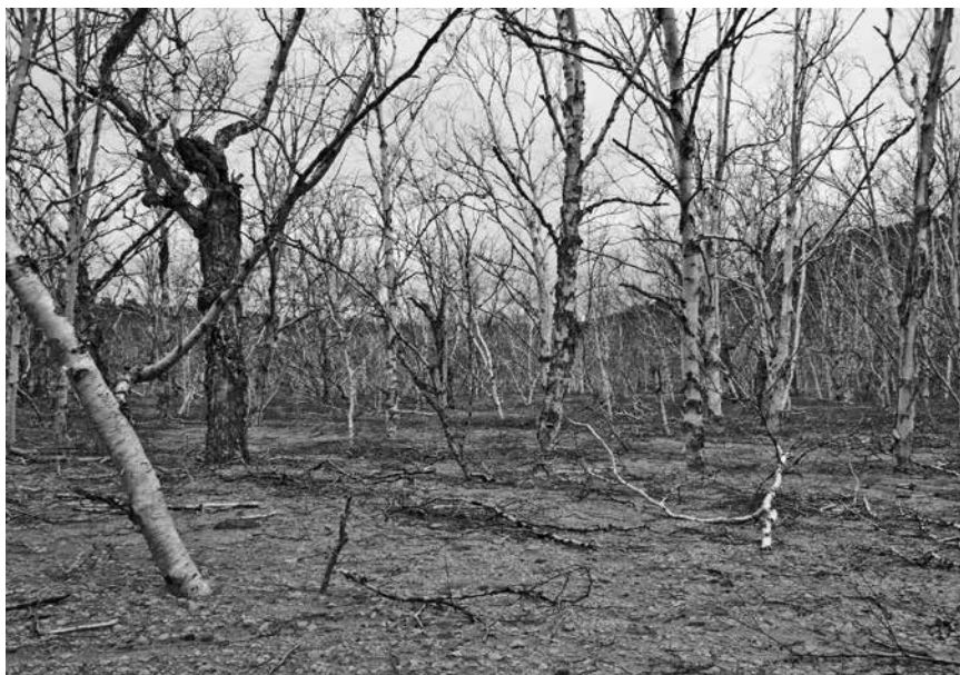
Рис. 3. Лес из березы каменной, погибший после погребения холодными пирокластическими отложениями, переотложенными лахарами. 2008 г.

Время от времени по долине р. Байдарная отмечаются новые, относительно небольшие, пирокластические потоки. Заметные по размерам потоки сходили в сентябре 2005 г. и в июле 2013 г. [3]. В декабре 2013 г. поток (его горячие отложения хорошо видны на