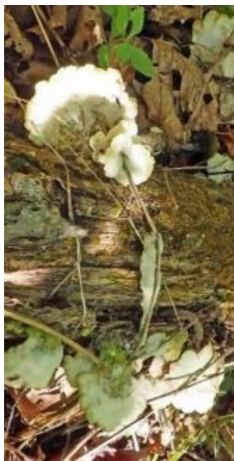
Рис. 4Пр. Oxyporus phellodendri Fig. 4Suppl. Oxyporus phellodendri.