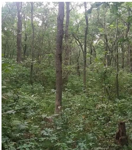
Рис. 1. Дубняк на северной границе заповедника

Растительность на о-ве Попова представлена преимущественно полидоминантными широколиственными дубовыми и липовыми лесами, которые являются производными от южных хвойно-широколиственных лесов с чёрной пихтой и кедром [9]. Большая часть п-ова Ликандера покрыта лесом с преобладанием дуба (Рис. 1), местами с существенной примесью клёна, липы, ольхи, изредка лещины, берёзы и некоторых других пород (Рис. 2).