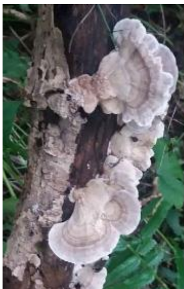
Рис. 13Пр. Trametes conchifer Fig. 13Suppl. Trametes Conchifer