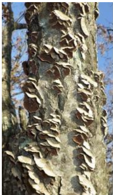
Рис. 7Пр. Trichaptum polycystidiatum Fig. 7Suppl. Trichaptum polycystidiatum