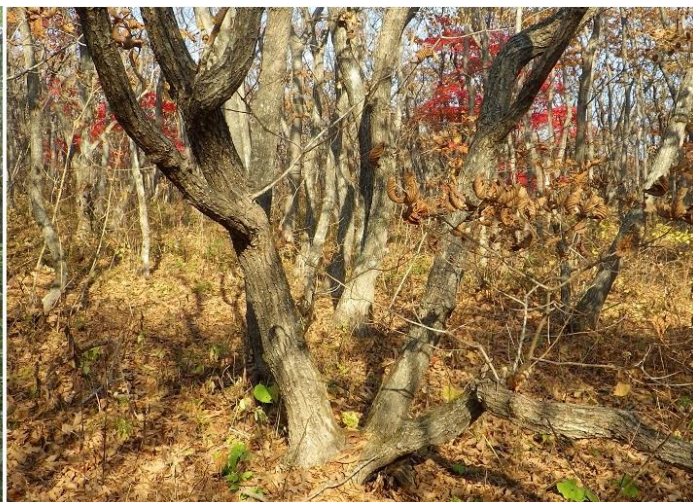
Рис. 2. Дубняк с кленом на п-ове Ликандера о-ва Попова