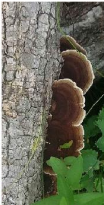
Рис. 11Пр. Daedaleopsis tricolor, молодое плодовое тело Fig. 11Suppl. Daedaleopsis tricolor, young basidiome