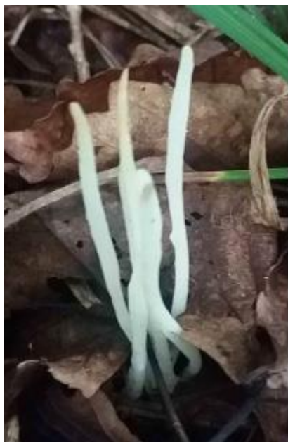
Рис. 1Пр. Clavaria fragilis Fig. 1Suppl. Clavaria fragilis

Supplementary material. Photographs of aphyllorphoroid fungi in their habitats on the Popov Island