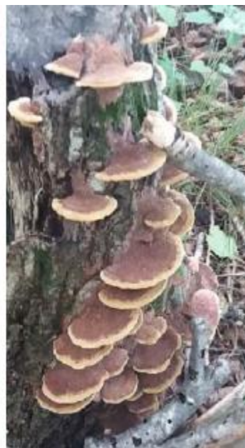
Рис. 3Пр. Fuscoporia gilva Fig. 3Suppl. Fuscoporia gilva