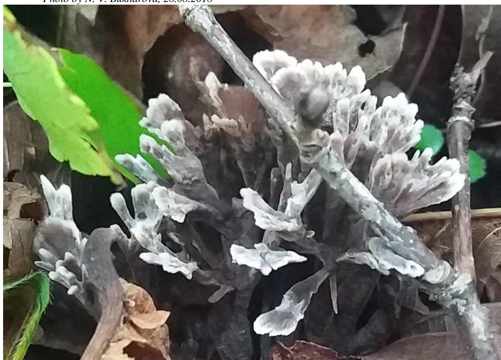
Рис. 18Пр. Thelephora palmata