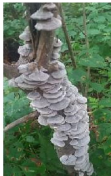
Рис. 15Пр. Trametes Versicolor Fig. 15Suppl. Trametes versicolor