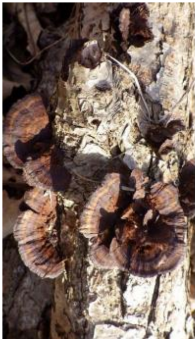
Рис. 10Пр. Daedaleopsis tricolor Fig. 10Suppl. Daedaleopsis tricolor