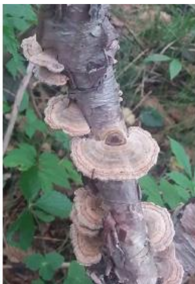
Рис. 14Пр. Trametes ochracea Fig. 14Suppl. Trametes ochracea