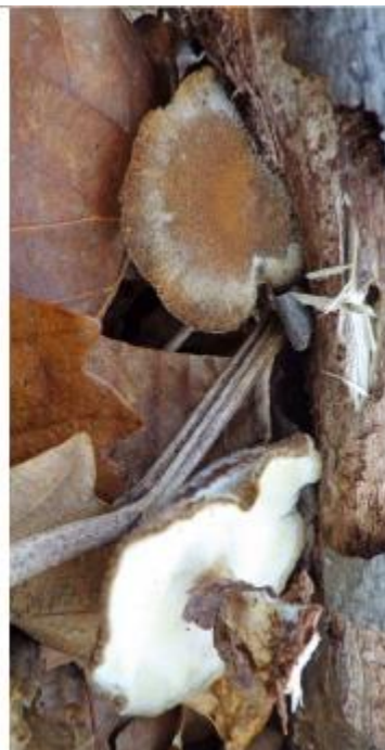
Рис. 12Пр. Lentinus brumalis Fig. 12Suppl. Lentinus brumalis