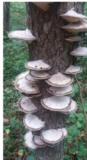
Рис. 9Пр. Daedaleopsis sinensis Fig. 9Suppl. Daedaleopsis sinensis