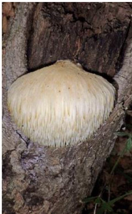
Рис. 17Пр. Hericium erinaceus