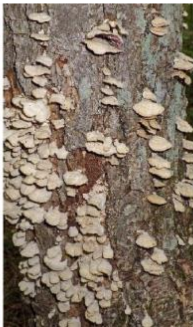
Рис. 5Пр. Trichaptum biforme Fig. 5Suppl. Trichaptum biforme