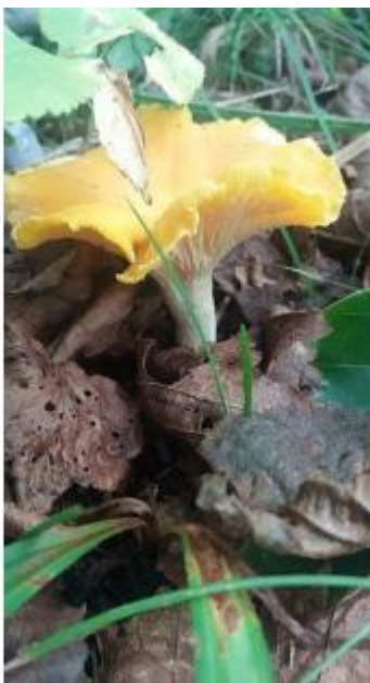
Рис. 2Пр. Cantharellus cibarius Fig. 2Suppl. Cantharellus cibarius