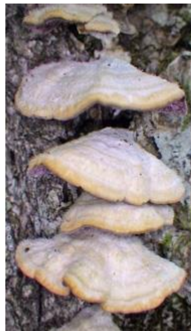
Рис. 6Пр. Trichaptum biforme ; увеличено Fig. 6Suppl. Trichaptum biforme, close view