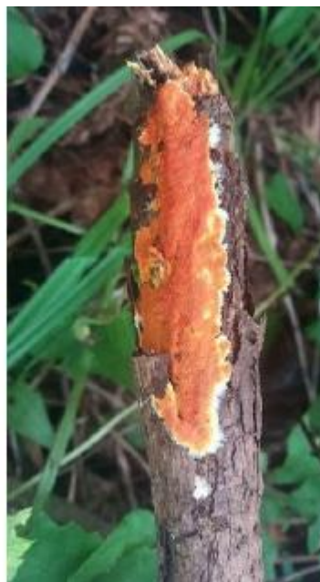
Рис. 8Пр. Hydnophlebia chrysorhiza Fig. 8Suppl. Hydnophlebia chrysorhiza