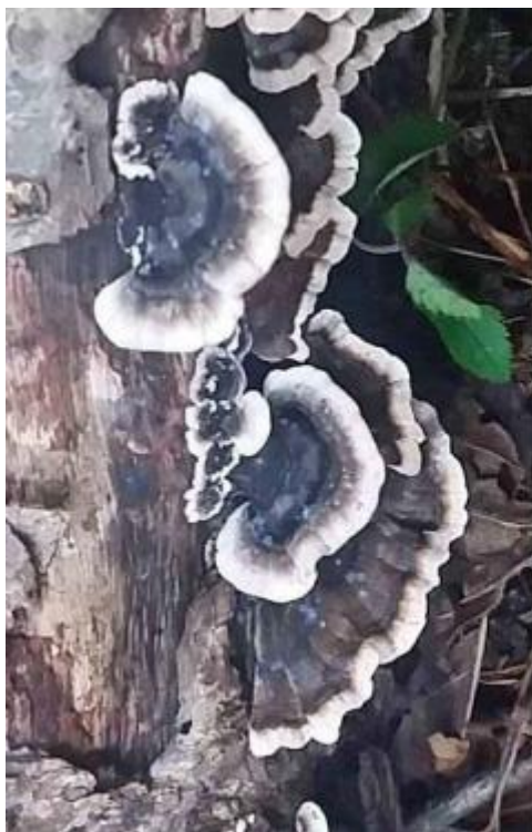
Рис. 16Пр. Trametes versicolor , молодое плодовое тело