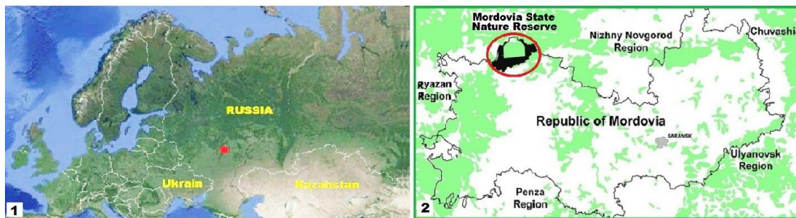
Рисунок 1: 1 — расположение Мордовского заповедника (красная точка) на карте России; 2 — расположение Мордовского заповедника (красный овал) на карте Республики Мордовии. Figure 1: 1 — the location of the Mordovian Reserve (red dot) on the map of Russia; 2 — the location of the Mordovian Reserve (red oval) on the map of the Republic of Mordovia.

Материалы и методы. Мордовский заповедник имени П. Г. Смидовича имеет площадь 32 162 га и находится в Темниковском районе Республики Мордовия (Рис. 1).