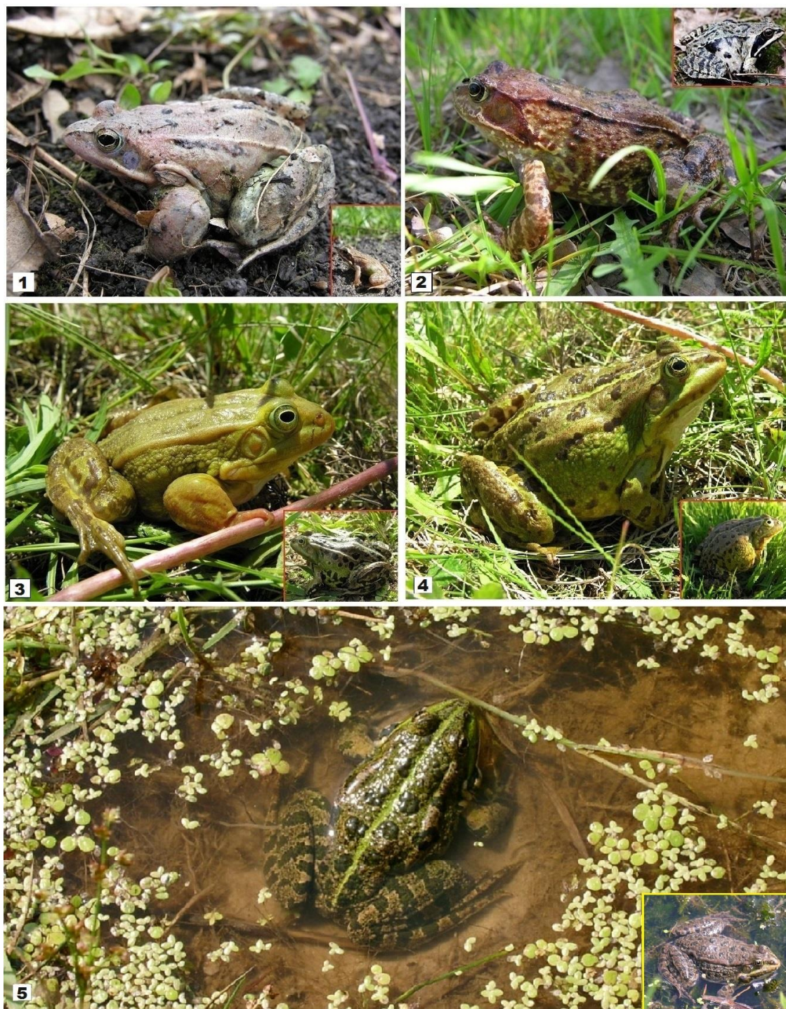
Рисунок 4. Земноводные Мордовского заповедника (Figure 4. Amphibians of the Mordovian Reserve), family Ranidae: 1 — Rana arvalis Nilsson, 1842; 2 — Rana temporaria Linnaeus, 1758; 3 — Pelophylax lessonae (Camerano, 1882); 4 — Pelophylax esculentus (Linnaeus, 1758); 5 — Pelophylax ridibundus (Pallas, 1771).