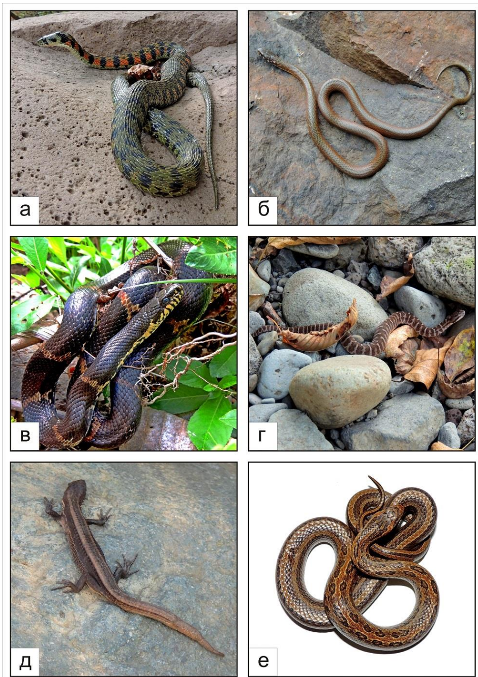
Рис. 2. А – половозрелая особь Rhabdophis tigrinus ; Б – половозрелая особь Hebius vibakari ; В – половозрелая особь Elaphe schrenckii ; Г – половозрелая особь Gloydius intermedius ; Д – половозрелая особь Takydromus wolteri ; Е – половозрелая особь Oocatochus rufodorsatus .

Fig. 2. А – the adult of Rhabdophis tigrinus ; Б – the adult of Hebius vibakari ; В – the adult of Elaphe schrenckii ; Г – the adult of Gloydius intermedius ; Д – the adult of Takydromus wolteri ; Е – the adult of Oocatochus rufodorsatus .