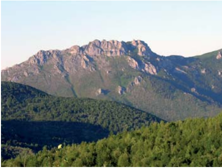
Рис. 2. Гора Вайда, северо-западная вершина. Фото В.Ю. Баркалова, 18 августа 2006 г. [Fig. 2. Mt. Vaida, the north-western top. Barkalov V.Yu., Aug. 18, 2006].

скальные, с отвесами до 40–50 м. Гора является одной из господствующих вершин на водоразделе между реками Мелкой (бассейн Охотского моря) и Витницей (верховья р. Рукутама до слияния с р. Голубикой, бассейн залива Терпения). Тело известняков расчленено крупными разрывными нарушениями на четыре отдельных выхода. Развит карст.