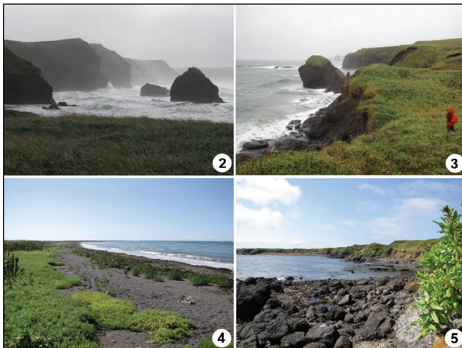
Рис. 2–5. Рельеф островов Юрий (2–3) и Полонского (4–5): 2 – бухта Широкая, о. Юрий; 3 – вид на мыс Южный, о. Юрий; 4 – бухта Моряков, о. Полонского; 5 – бухта Удобная, о. Полонского.

соединены с Хоккайдо и островами Большой Курильской гряды, на них не сохранилось реликтовых элементов третичной фауны, представленных на Кунашире и в Японии (Сундуков, 2014).