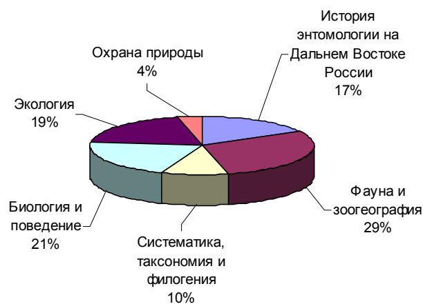
Рис. 1. Соотношение тематик докладов

За прошедшие 15 лет вышло из печати 15 сборников серии «Чтения памяти Алексея Ивановича Куренцова», в которых опубликовано 113 докладов. Из них 33 доклада (29%) посвящены фаунистике и зоогеографии, 24 (21%) - биологии и поведению и 22 (19%) – экологии различных групп членистоногих Дальнего Востока (рис. 1). Отдельный интерес представляет ряд докладов, в которых рассматривается история становления энтомологии на Дальнем Востоке России. Таких докладов было 19 (17%) и посвящены были они не только общей истории энтомологических исследований (А.С. Лелей «История энтомологических исследований на Дальнем Востоке». Вып. I–II) в нашем регионе, но и рассматривали вклад отдельных личностей в эту область биологической науки (доклады Е.В. Новомодного, вып. XIII–XIV), а также развитию отдельных направлений в изучении не только насекомых, но и других групп членистоногих (Н.А. Рябинин «История изучения фауны панцирных клещей (Acariiformes, Oribatida) Дальнего Востока России». Настоящий выпуск). По систематике, таксономии и филогении насекомых было сделано 11 (10%) докладов, из которых следует отметить доклад С.Ю. Стороженко «Система и филогения отряда гриллоблаттидовых (Insecta: Grylloblattida)» (вып. VII) и М.Г. Пономаренко «Выемчатокрылые моли подсемейства Dichomeridinae (Lepidoptera, Gelechiidae): функциональная морфология, эволюция и классификация»