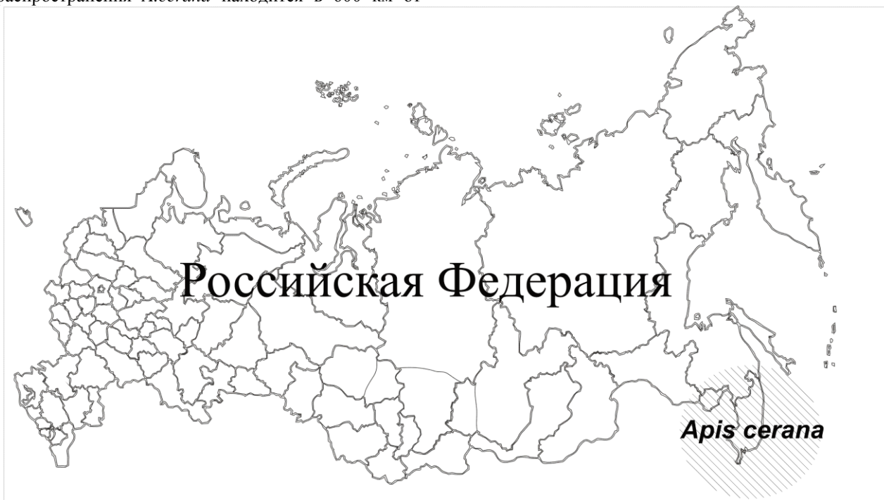
Рис. 1. Дальневосточная популяция Apis cerana в России

На территории России ареал A.cerana очень узкий - юг Дальнего Востока - 7 районов Приморского и 2 района Хабаровского краев. A.cerana на данный момент в незначительной численности встречается в лесах Хасанского, Надеждинского, Уссурийского, Кировского, Чугуевского, Дальнереченского и Красноармейского районов Приморского края (Рис. 1) [Кузнецов, 2005].