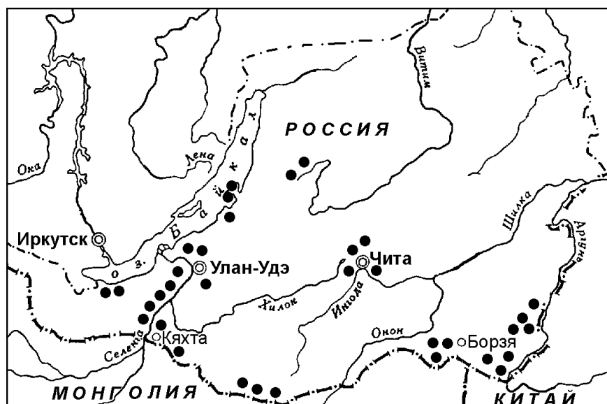
Рис. 1. Места сбора пчел в Забайкалье

Оценка относительного обилия фауны пчел проведена по 5-балльной логарифмической шкале (Песенко, 1972). Сходство фаун устанавливалось кластерным анализом с помощью программы PAST, версия 1.57 (Hammer et al., 2006) (метод UPGMA). В качестве меры сходства использован коэффициент Сьеренсена. Статистическая достоверность образования кластеров оценена при помощи бутстреп-анализа. Оценка бутстреп-значений проведена в 1000 повторностей.